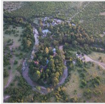
Fig Tree Camp ★★★