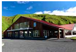
Hotel Katla by Keahotels 3* Categoría: ***