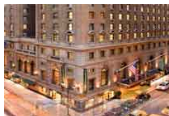
Nueva York - Hotel Roosevelt Categoría: ****

Con una ubicación privilegiada en el corazón de Manhattan, este precioso