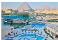
2 Egipto - Primera Categoría: *****