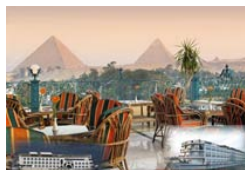
1 Egipto - Turista Categoría: 4* | 5*