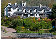
Fort William - Hotel The Lodge Categoría: ***

Situado en el corazón de la majestuosa ciudad georgiana de Edimburgo, a 5 minutos de princes street, la principal calle comercial de Edimburgo.