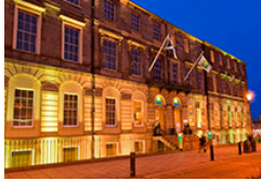
Edimburgo - Hotel Holiday Inn Express City Center Categoría: ***

Situado en el corazón de la majestuosa ciudad georgiana de Edimburgo, a 5 minutos de princes street, la principal calle comercial de Edimburgo.