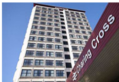
Glasgow - Hotel Premier Inn Categoría: ***

Esta popular propiedad se encuentra en Fort william. Hay un total de 12 habitaciones. La propiedad cuenta con 11 habitaciones dobles. El edificio ofrece acceso para minusválidos. Hay aparcamiento en las instalaciones. Se admiten animales.