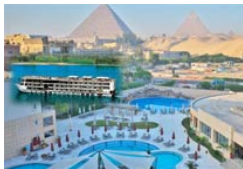
2 Egipto - Primera Categoría: *****