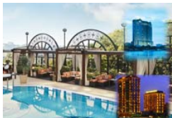
4 Egipto - Lujo Categoría: *****

Información mas detallada en nuestro Blog