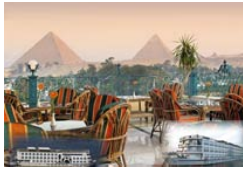
1 Egipto - Turista Categoría: 4* | 5*