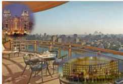
3 Egipto - Superior Categoría: *****