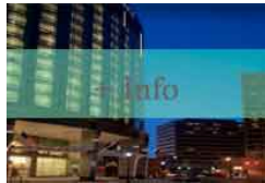
Arlington - Renaissance Arlington Capital View Hotel Categoría: ***

Este hotel de Arlington se encuentra a solo 1,6 km del aeropuerto nacional Ronald Reagan Washington y ofrece una piscina cubierta y un vestíbulo elegante. Dispone de habitaciones con TV de alta definición de 37 pulgadas y panel de conexión de accesorios.