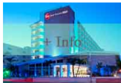
Miami - Hotel Best Western Atlantic Categoría: ***

Este hotel de Arlington se encuentra a solo 1,6 km del aeropuerto nacional Ronald Reagan Washington y ofrece una piscina cubierta y un vestíbulo elegante. Dispone de habitaciones con TV de alta definición de 37 pulgadas y panel de conexión de accesorios.