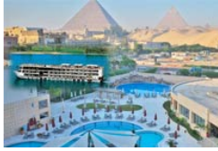
2 Egipto - Primera Categoría: *****