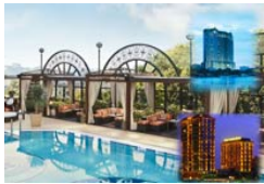
4 Egipto - Lujo Categoría: *****

Información mas detallada en nuestro Blog