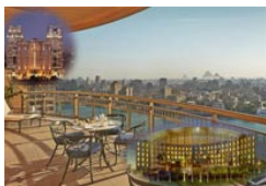
3 Egipto - Superior Categoría: *****